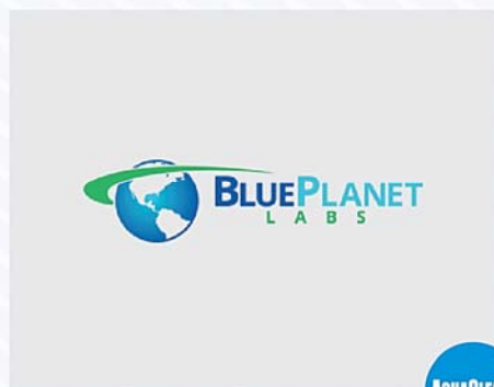
Đại diện của Blue Planet Labs tại Việt Nam